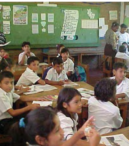
Esta aula de tercer grado ejemplifica el uso regular de una diversidad de materiales didácticos, la disposición cooperativa de los asientos, y las técnicas de aprendizaje interactivo para mejorar la lectura.

escuela; evalúa la eficacia interna de un sistema educativo; y apunta hacia un mayor rendimiento académico (bajo el supuesto de que la mayor permanencia en la escuela resulta en un mejor aprendizaje). Por lo general, los alumnos matriculados en las escuelas modelo permanecen más tiempo en la escuela, y habitualmente terminan el sexto grado.