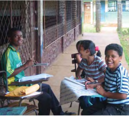
Alumnos disfrutan de un trabajo en grupos.