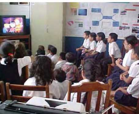
Alumnos de segundo grado aprenden mediante tecnología audiovisual.

democracia en las escuelas que participaron en el proyecto. La participación democrática de la comunidad en apoyo de la calidad de las escuelas, se ha convertido en una característica destacable de la reforma de educación primaria en Nicaragua. El gobierno estudiantil también es importante para la construcción de la democracia y para afianzar la enseñanza y el aprendizaje en las aulas.