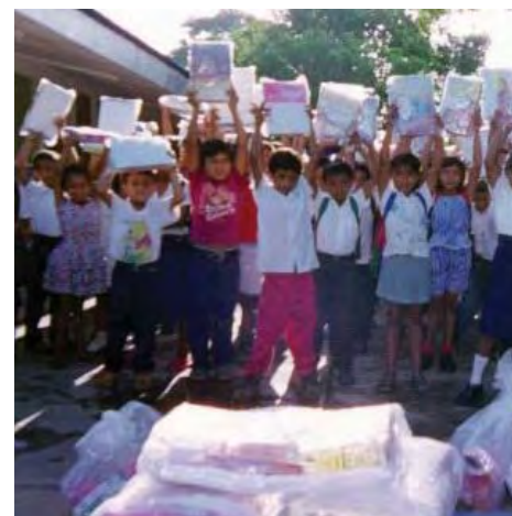
Niños con materiales educativos entregados después del Huracán Mitch.

El apoyo del gobierno de los Estados Unidos, canalizado a través de 13 agencias federales diferentes, proporcionó $545.1 millones para las actividades de reconstrucción en los cinco países afectados por el huracán Mitch, más un programa regional para América Central. El programa de recuperación después del huracán, con