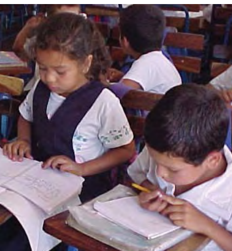
Alumnos de primer grado trabajan en una tarea de lectura independiente en una escuela atendida por USAID.

donante bilateral en materia de educación. Las actividades de los últimos cinco años fueron guiadas por dos estrategias nacionales de USAID: la primera desde 1995 hasta 2002 (extendida para abarcar las actividades de reconstrucción luego del huracán Mitch), y la última desde 2003 hasta 2008.