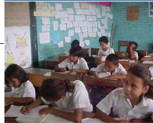
Alumnos en aulas respaldadas por CETT en clase de lectura.