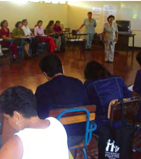
Taller de Capacitación de Maestros en el proyecto CETT.