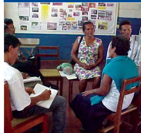
Padres participan en una reunión escolar.