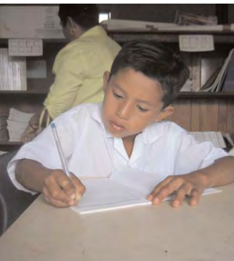
Un alumno en una escuela respaldada por la Alianza Mundial para el Desarrollo (GDA) trabaja en una actividad de matemáticas.